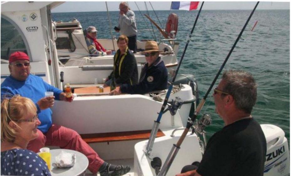
Les plaisanciers s'adaptent vite

On a beau prévoir, la mer a toujours le dernier mot : les plaisanciers proposent et la mer dispose !!!